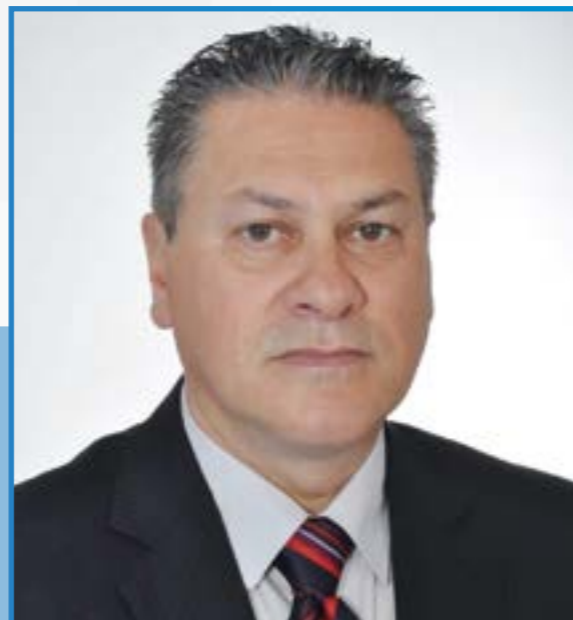
Leonel Egídio Colossi Vice-Prefeito • MDB