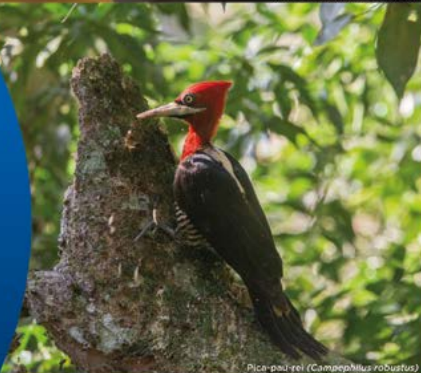
Pica-pau-rei ( Campephilus robustus )

Rua: Sergipe, 141 - Centro Santa Rosa - RS CEP: 98780-549