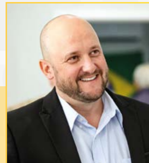
Francione Capellare Vice-Prefeito • PL