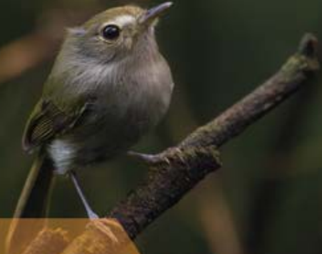
Olho-falso ( Hemitriccus diops )