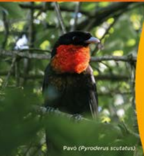
Pavó ( Pyroderus scufatus )