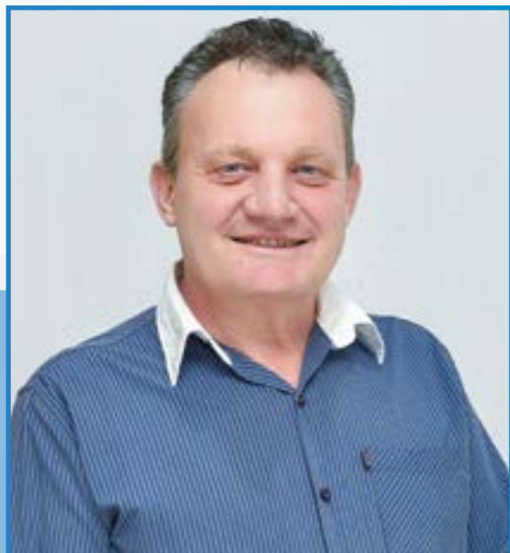
Jaime Domingos Tafarel Prefeito • PDT