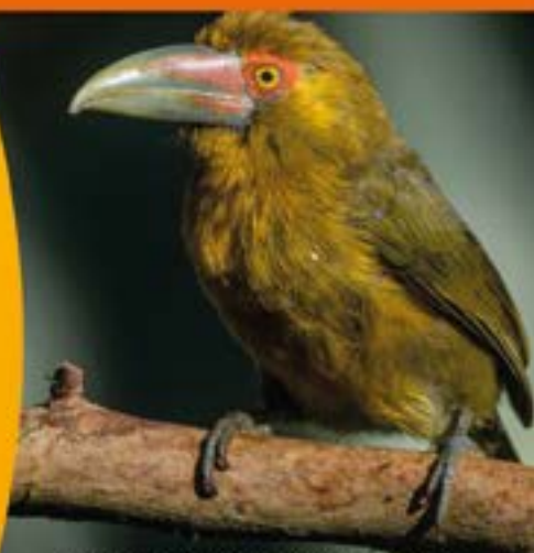
Araçari-banana ( Pteroglossus bailloni )