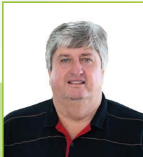
Aureo Gilnei Schenkel Vice-Prefeito • PP