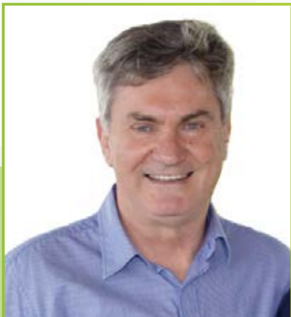
Ari Edmundo Roehrs Prefeito • MDB