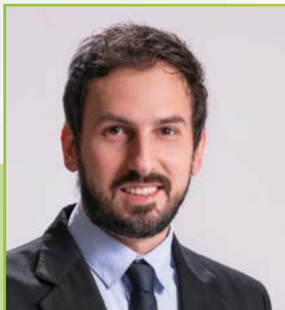
Marcos Vinícius Benedetti Corso Prefeito • PP