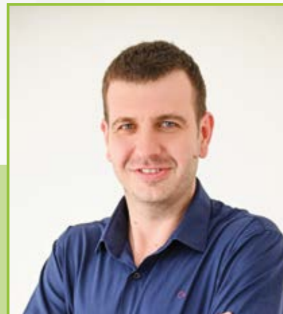
Charles Thiele Prefeito • MDB