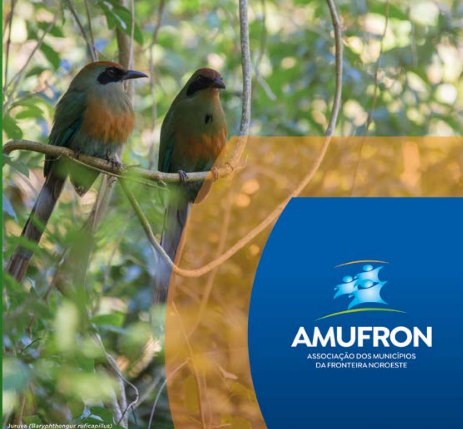
Juruva ( Baryphthengus ruficapillus )