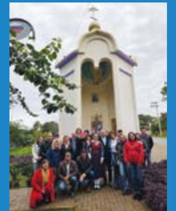
Campina das Missões