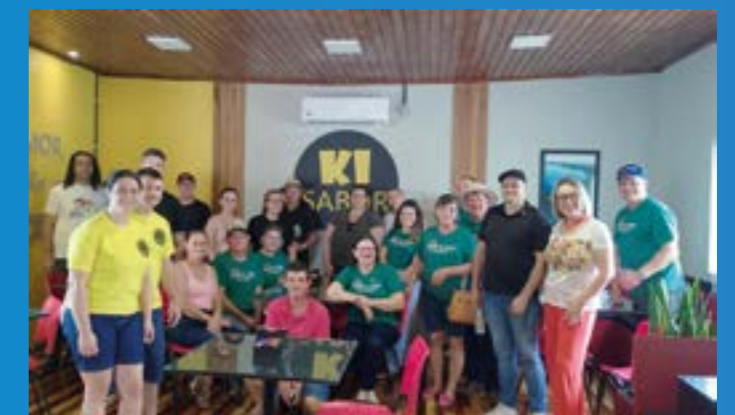
Porto Vera Cruz